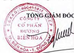
Trần Quế Trang